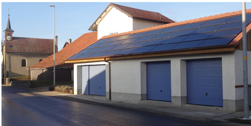
Le bâtiment du Pressoir fraîchement rénové